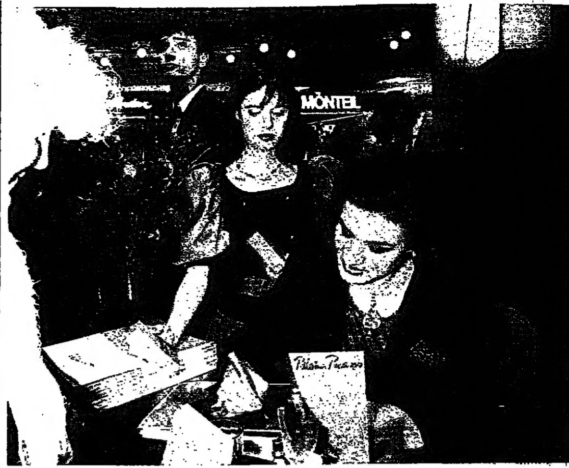
بالوما تولع في باريس

لم تشمل الاطفال مع علاقتهم وتطلبت رعايتهم على لفضل وجه مهارة وحذقا وحساسية.